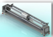
Ločen navijalni sistem z IR sušilec