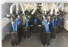
6 Starfire tiskalnih glav v treh vrstah