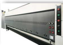
Pametni IR sušilni sistem