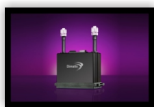
Dimatix Starfire 1024 tiskalne glave