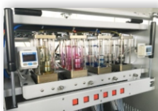
GnTeck sistem za negativni pritisk